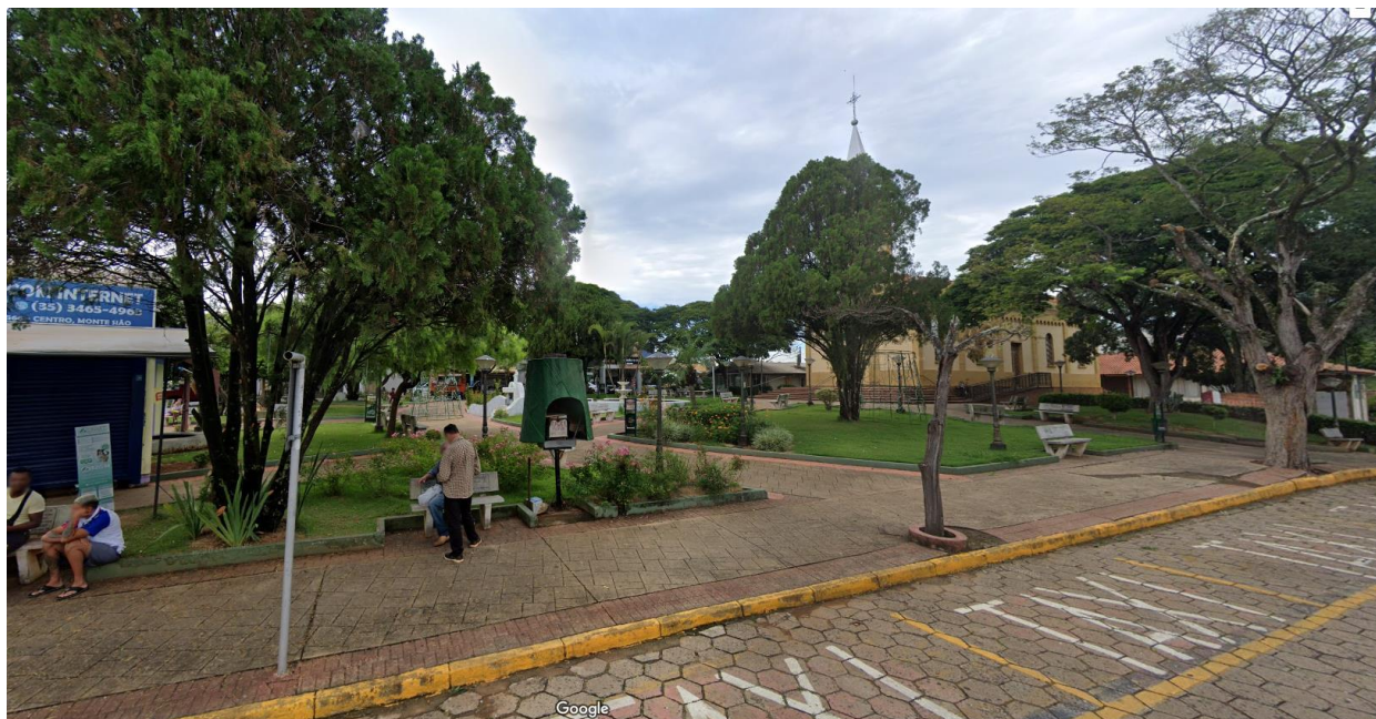
Imagem 4 -Praça do Rosário