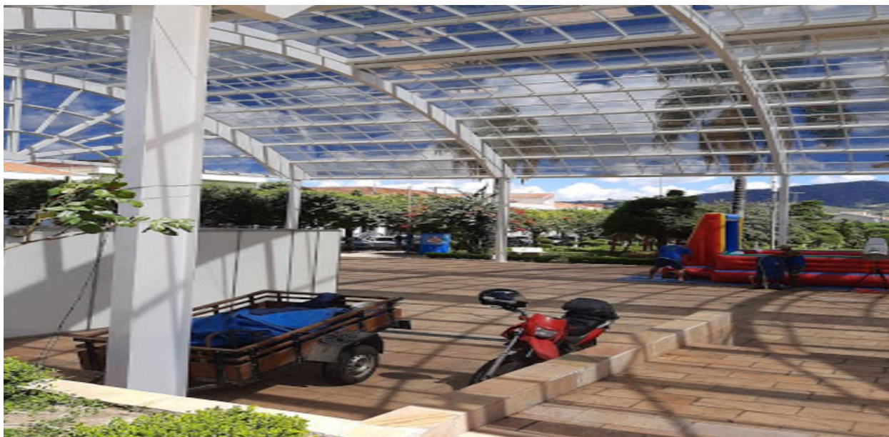
Imagem 3 – Praça Prefeito Mário Zucato