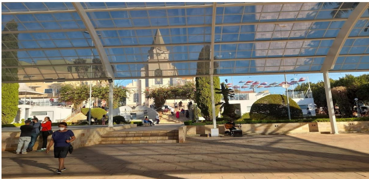
Imagem 1 – Praça Prefeito Mário Zucato

Assim, verifica-se os locais que serão realizados a maioria dos eventos (mediante relatório fotográfico) para fins e organização do estudo: